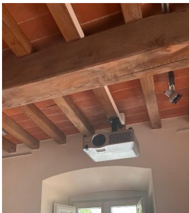
Proiettori sale espositive Palazzo Achilli ai quali sono state sostituite le lampade