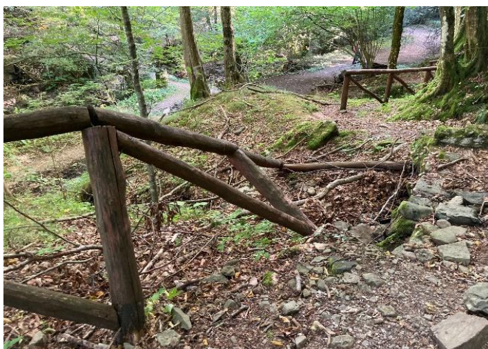
Staccinata ceduta Itinerario del Ghiaccio