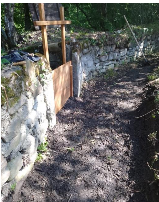
Rifacimento calla Itinerario del Ferro