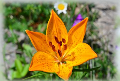
Lilium bulbiferum L. (Giglio di San Giovanni)