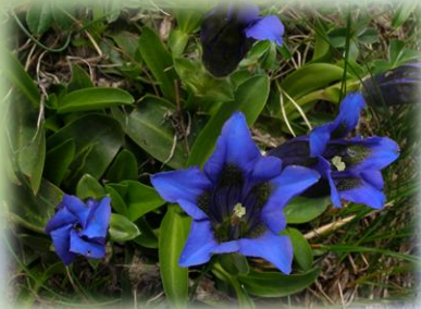
Gentiana acaulis L.